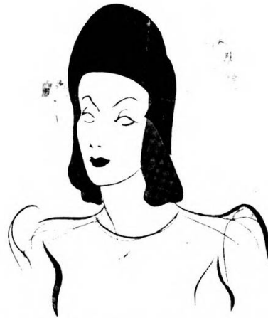
Quattro eleganti cappelli, presentati dall'Ente Nazionale della Moda. Il primo è in feltro morbido, con falda molto ampia e guarnizioni di nastro sul davanti. Vedete poi una originale creazione ad elmetto, ben calzata fino alla nuca, e con un'alta striscia semi-