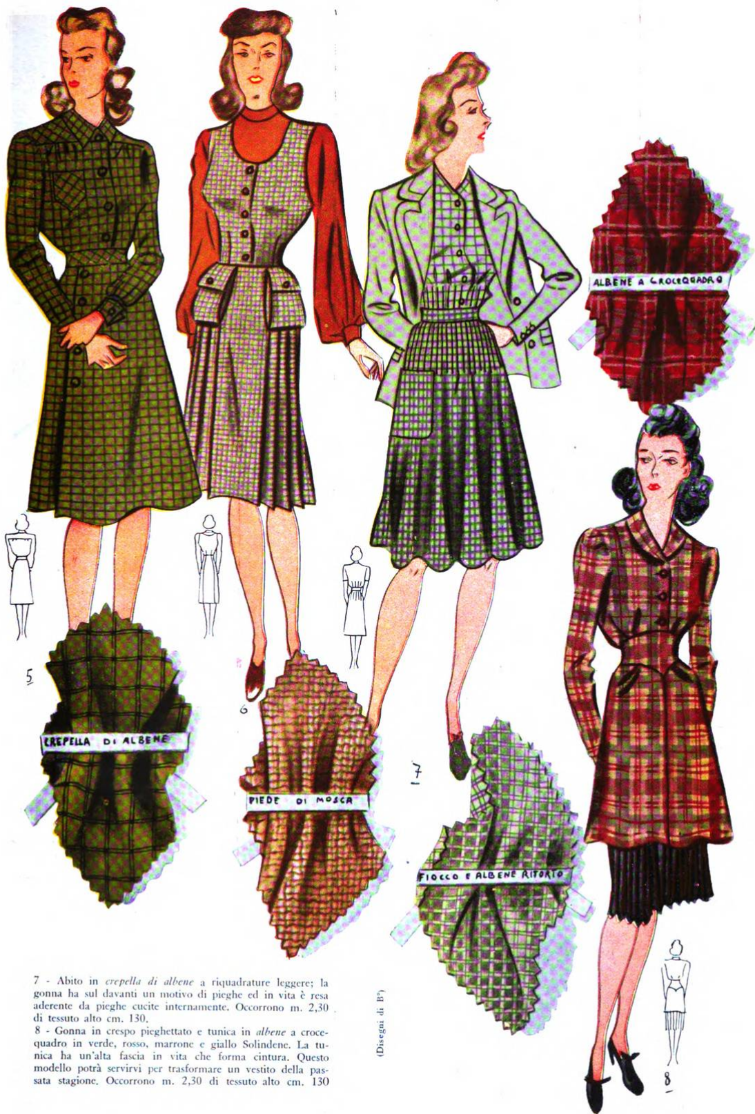
7 - Abito in crepella di albene a riquadrature leggere; la gonna ha sul davanti un motivo di pieghe ed in vita è resa aderente da pieghe cucite internamente. Occorrono m. 2,30 di tessuto alto cm. 130. 8 - Gonna in crespò piegheggiato e tunica in albene a crocequadrò in verde, rosso, marrone e giallo Solindene. La tunica ha un'alta fascia in vita che forma cintura. Questo modello potrà servirvi per trasformare un vestito della passata stagione. Occorrono m. 2,30 di tessuto alto cm. 130