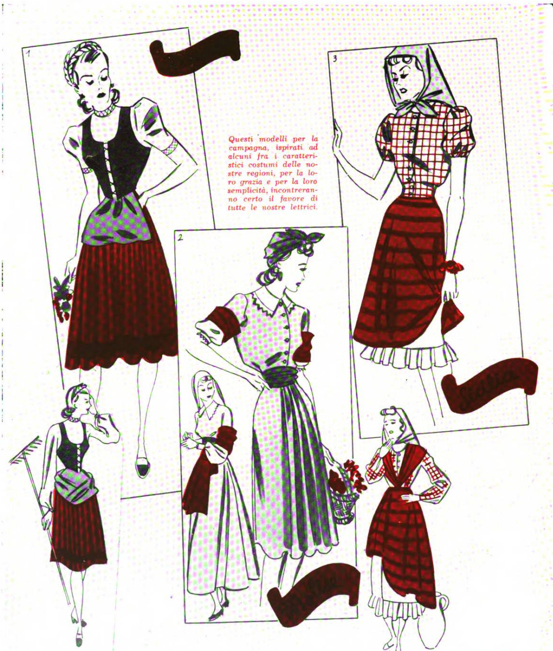
1) Gonna in grossa tela rigata di colore vivace e corpetto in velluto o in fustagno stringato davanti. Il piccolo grembiule arricciato davanti è in tessuto celeste. Camicetta bianca, abbottonata dietro, con bordi a tinta viva. 2) Abito in leggera crepella verde scuro con ampia arricciatura davanti e cintura drappeggiata: le maniche hanno un ampio risvolto color fragola e la parte inferiore piuttosto ampia e stretta in fondo da un bordino di pizzo è in renna bianca come il colletto. Fazzoletto color fragola. 3) Gonna in tessuto di colore vivace con righe di due tonalità Solindene. Questa gonna poggia sopra una sottoveste bianca con ampio volante. Il corpetto molto morbido e stretto in vita da una cinturina è in tessuto a quadretti. Il fazzoletto è azzurro. 4) Gonna azzurra o rossa con bordo applicato nero. Corpetto in tinta contrastante (ad esempio azzurro se la gonna sarà rossa etc.) con maniche ampie in albene bianco e bordo allo scollo nella tinta della gonna. Grembiolino in tessuto stampato a disegni vivaci Solindene. 5)