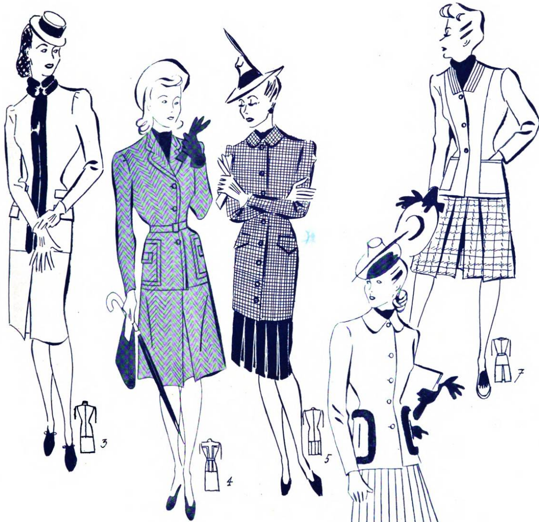
1) Abito a giacca realizzato in crespo Romano Cresta blu Romantrene. Gonna scampanata, con doppia piega laterale; giacca attillata, a collo bordato di pelo. 2) Abito a giacca, la cui gonna segue nelle pieghe laterali la linea delle cuciture nella giacca. Collo di pelo. 3) Abito a giacca in tessuto Rasato Fiorentina , con gonna liscia; giacchetta lunga e attillata, solo guarnita da due giri di pelo al collo, che discendono sul davanti. 4) Gonna con piega centrale profonda; giacchetta sportiva, con bordi impunturati e cintura alla vita: questo insieme va realizzato in tessuto spigato. 5) La gonna di questo originale completo è di flanella verde scuro a pieghe per tutta la sua circonferenza. Giaccona attillata e lunga a tre quarti, in tessuto a quadretti verdi e rossi. 6) Abito a giacca con gonna costituita di piccoli teli e giacchetta liscia, solo guarnita dai bordi di pelo attorno alle tasche. 7) Completo sportivo costituito di gonna-pantaloni di panno fantasia, con piega volta all'interno, e di giacchina in tinta unita, scollata in tondo e con cuciture intorno.