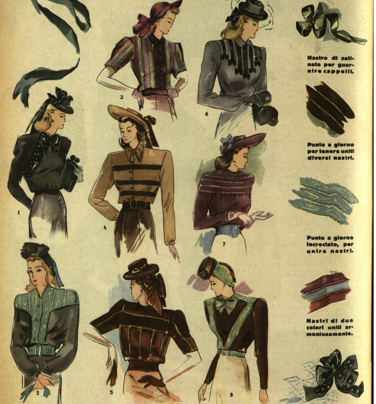
1) Trasformazione di una vecchia camicetta in nuova con l'aggiunta di un nastro. 2) Nastro marezzato come sprone e davanti. 3) Camicetta di nastri di taffetà in tre colori, tenuti uniti con un ricamo a giorno. 4) Camicetta di seta chiara tagliata orizzontalmente con nastri di seta. 5) Camicetta formata da alti nastri di velluto uniti a ricamo a giorno. 6) Guarnizione di nastri di velluto nero e nodi. 7) La parte superiore di questa camicetta è di nastro unito. 8) Nastri di seta marezzata, per questa camicetta.