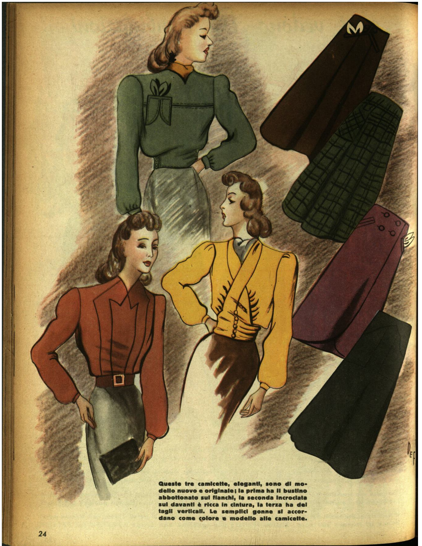
Queste tre camicette, eleganti, sono di modello nuovo e originale; la prima ha il bustino abbottonato sui fianchi, la seconda incrociata sul davanti è ricca in cintura, la terza ha dei tagli verticali. Le semplici gonne si accordano come colore e modello alle camicette.